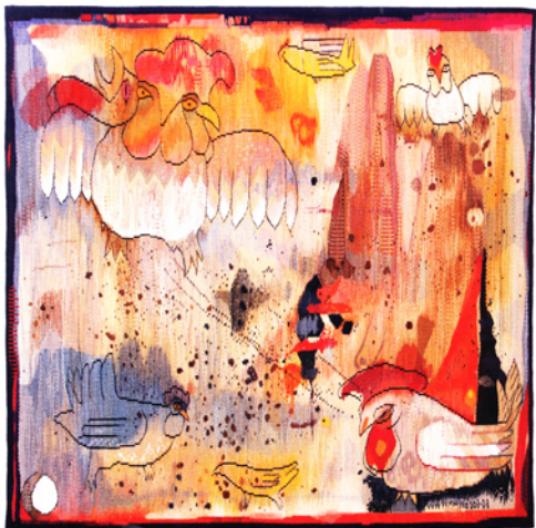
Mette N. Handberg, Chatbox, 2011 ©Mette N. Handberg/BONO 2013