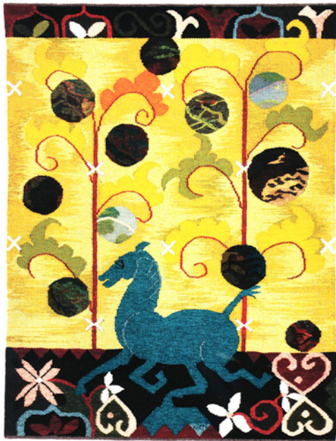
Kamme Greiff, Kina erobrer verden, 2012 ©Kamme Greiff/BONO 2013

å delta. Dette kan føre til at museer tenker seg om to ganger om før de bestiller utstillere med dyre produkter Billedvev er jo kostbare arbeider som det tar tid å skape. Her er det langsom spontanitet som gjelder!