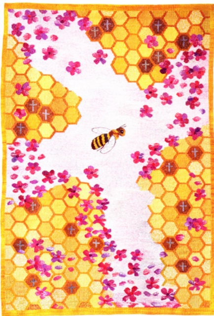
"Verdens viktigste summetone" av Anne-Kirsti Espenes 2012

vevnader i samme format, 55 x 55 cm. Ett arbeid fra hver av de fire. I tillegg vises individuelle arbeider med tilknytning til det felles samlede tema Verdensveven/ Weave World Wide. Her vil formatene være forskjellige. Vi hadde aldri greid en utstilling i året hver for oss. Egen web-side var også et mål i prosjektet. Og vi har klart det, sier Randi om prosjektet som avsluttes neste år.