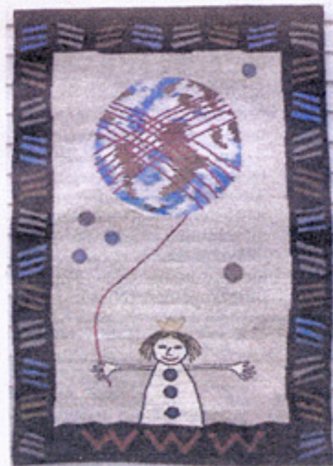
«EXIT» Randi H. Hjorth, 130 x 130 cm.